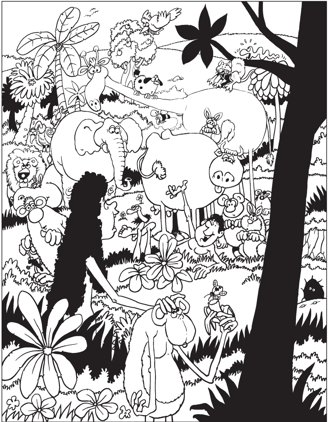
Adán y Eva disfrutaban del hogar que Dios creó.